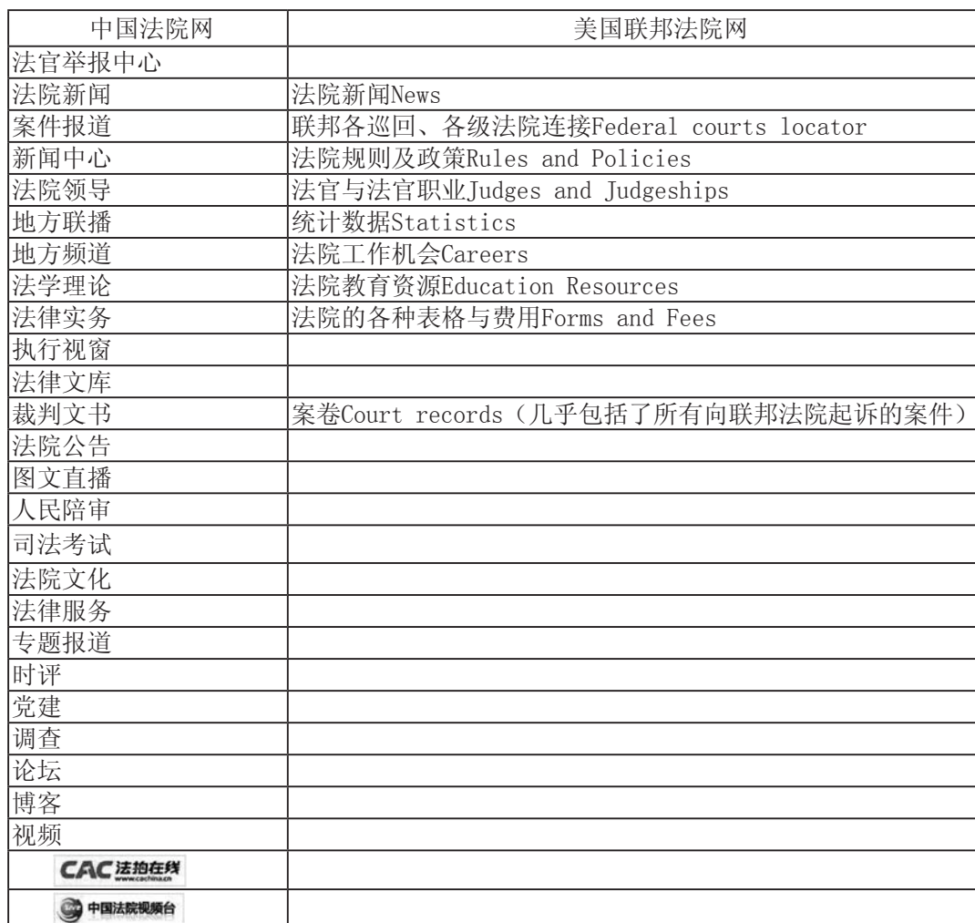
表一：中国法院网(chinacourt.org)和美国联邦法院网(uscourt.gov)主页板块比较：

的指导，法官的工作不仅审理案件，还要积极为当事人调解，地方法官甚至主动访问涉案人员和单位，调解纠纷为群众排忧解难。而美国联邦各个巡回法院及其各级法院都相对独立，法官的工作主要是审理案件，保持中立，公正判案。