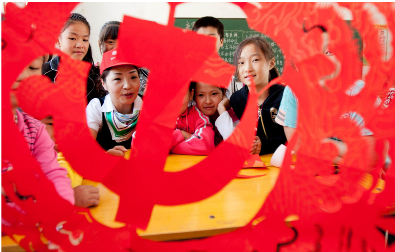
今天的中国，应当理直气壮地宣称自己的社会主义核心价值观和政治经济基本制度。

中国当下面临的实为一体体系构造的问题，不仅是体制改革，也不仅是意识形态重塑。正是因为体系紊乱，才会出现精英阶层，即占据政治经济文化领域一定优势的人士，几乎无人不腐败。体系紊乱之表现，一是思想文化极度混乱，不存在主流价值观；二是对外金融依附输出财富，内部土地食利制造贫富分化，这种经济模式任何健康意识形态都无法落地生根。将中国问题诊断为