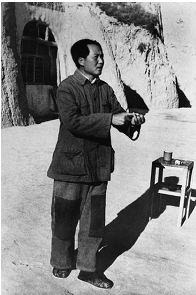
物质条件简陋，精神世界崇高。共产党领导下的延安展现出一种与众不同的气场。

讲的一张图片，这里不是要提倡艰苦朴素。注意这里的气场，物质条件极端粗陋，但是这是一个崇高庄严的场所、与会者从事的是伟大光荣的事业，这是真实的是与会者主体间的客观存在。