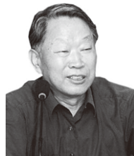
刘海年 (中国社会科学院荣誉学部委员)

于促进我国人权有关领域的保障力度。在全面完善和加强权力监督体系的同时，应特别关注对党政“一把手”的制约与监督。为了推进法治的民主化，除继续扩大民主参与和民主监督，在立法、执法、司法等各个环节，进一步提高工作的公开性和透明度。