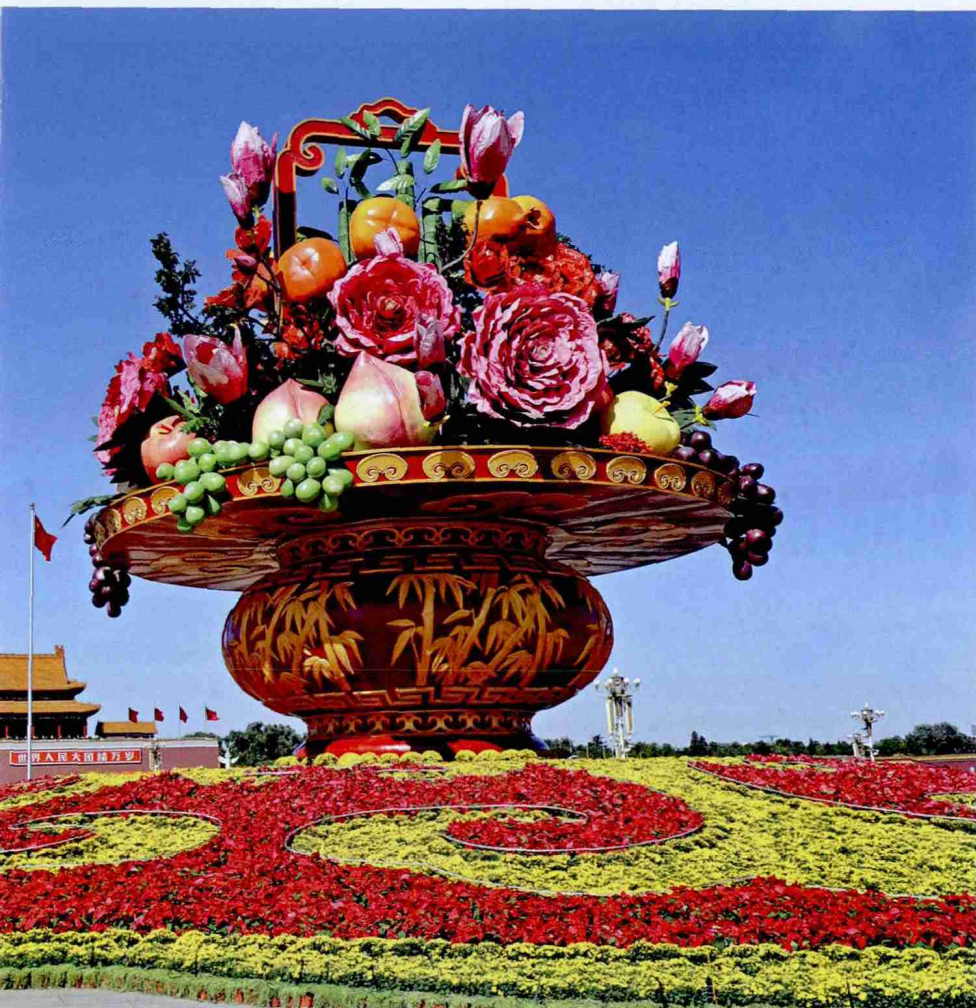
天安门广场国庆中心花坛“祝福祖国”

污染等行为进行监督和管理,从而最大限度地激发市场活力和企业创造力的同时预防和制止市场和企业的弊端。从宏观层面来说,政府应着力改革和完善当前的财政、税收、金融等制度,确保经济运行的平稳与安全。政府要做的不是简单地提高经济效率、促成GDP增长,而更应关注的是国家财政资金来源的合理性、支出的合法性以及社会分配的公平性等问题,从而为企业经营创造良好的市场环境,同时有效约束政府的行为。基于此,政府从微观和宏观两个层面上推进改革,在加强监管的同时更加倡导市场机制的作用,在关注效率的同时更加注重