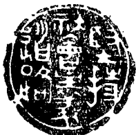
坚持社会主义道路

当前，调整国民经济，改革经济管理体制的工作正在全国深入地进行着。为使作为上层建筑的法学起到促进生产关系的改革、变化和巩固的作用，我们应该从我们国家的实际情况出发，对国营企业财产权的性质问题继续进行深入研究，作出科学的结论，使之切实为巩固社会主义经济基础，促进四化建设服务。